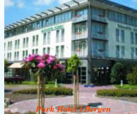
Park Hotel i Bergen

Vi kommer også til Prora, hvor Hitler lod opføre et af verdens største feriehoteletter med plads til 20.000 gæster. Byggeriet er flere kilometer langt, og blev aldrig helt færdigt på grund af krigens udbrud. Entré.