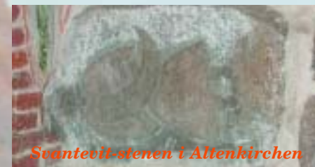
Svantevit-stenen i Altenkirchen

Efter morgenmaden kører vi til den charmerende gamle hansestad Stralsund, også kaldet "Porten til Rügen". Den gamle havn og bykernen er i dag en beskyttet Unesco kulturarv, der stadig renoveres. Stralsund er især kendt for sine mange gotiske huse og kirker. Gaderne er smalle og brostensbelagte. Der gøres ophold i byen, og først på eftermiddagen køres mod Rostock, og vi sejler til Danmark.