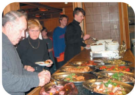
At rejse, det er livet

Ligger på toppen af Telemarken i 960 m's højde for foden af Gaustatoppen. Hotellet er hyggeligt indrettet med pejsstue, TV-stue, billard, bar med alle rettigheder, indendørs swimming-pool, whirl-pool, 2 badstuer, solarium, dansemusik 6 dage om ugen, 1. klasses køkken og børnevenlige omgivelser. Hvis De vil forkæle Dem selv kan hotellet tilbyde juniorsuiter, som er et stort rum samt bad og toilet eller suiter, som er 2 sammenhængende rum samt bad og toilet.